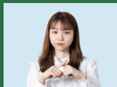
VEREINS-ABC Interessenten ablehnen