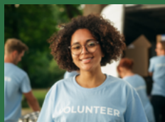
RECHTSFRAGE Geschenk an Helfer*in